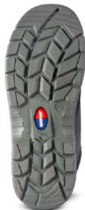
Botín Tempest 3020 Negro