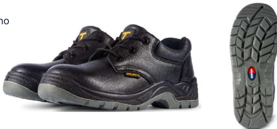
Zapato Tempest 3010 ND/Unisex